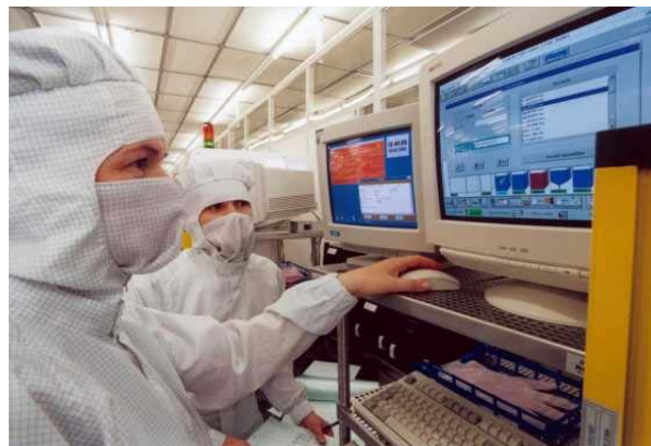
Arbeiten in Reinräumen bei der Herstellung von Halbleiterbauelementen

inside e.V., Adele-Sandroch-Str. 100, D-12627 Berlin, Telefon: 0160 83 07 445, Fax: 06979 12 30 457, e-mail: vorstand@inside-ev.org www.inside-ev.org