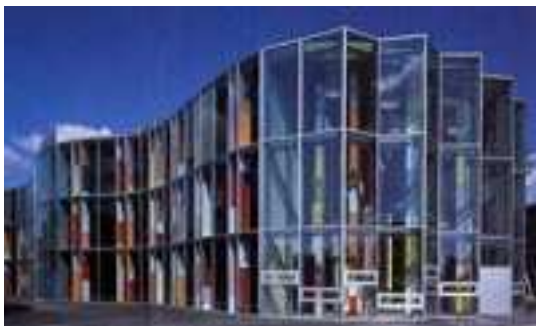
Zentrum für Photonik, Haus I

Wir laden Sie ein, mit uns gemeinsam das IAP zu besuchen.